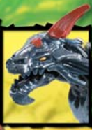
9607 SETH DRAGON METAL SLASH DRAGON™