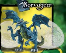
9605 VILE DRAGON WIND SPRINTER DRAGON™