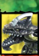
9606 BRIMER DRAGON DARK CLAW DRAGON™