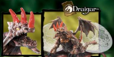
9609 BOULDER DRAGON CRYSTAL CAVERN DRAGON™