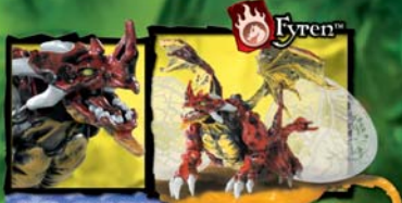
9608 CRYMSON DRAGON VULCAN FIRE DRAGON™