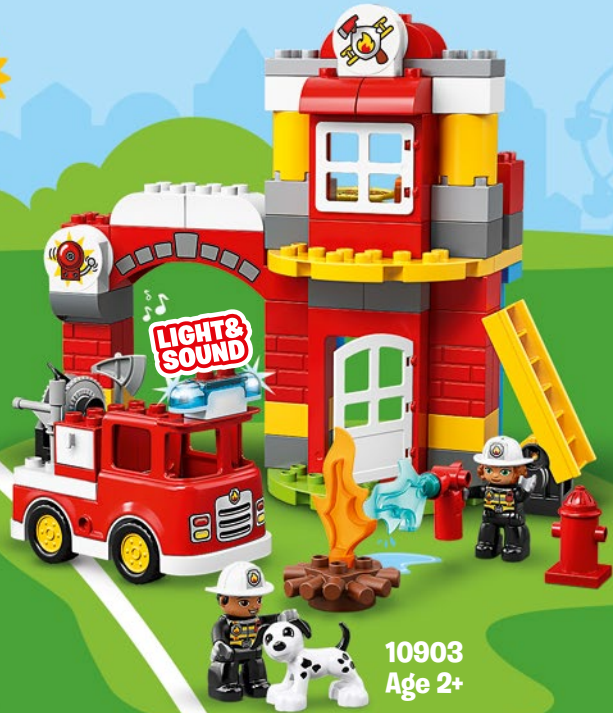
10903 Age 2+

Light and Sound Licht und Geräusche Son et lumière Luz e suoni Luz y sonidos Luz e Som Fény és hang Gaisma un skana 灯光和声音