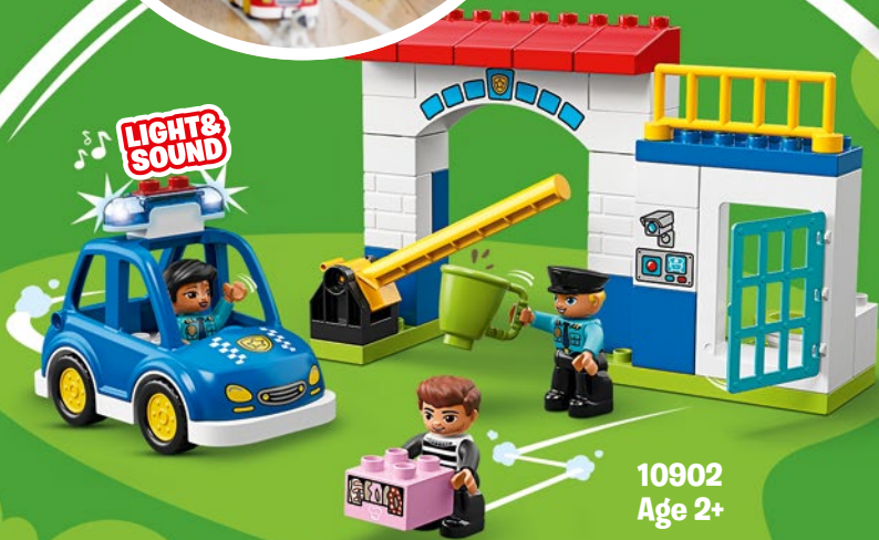
10902 Age 2+